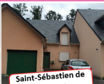
Saint-Sébastien de Morsent

Pavillon de 4 pièces (99 m 2 ), constr. 2002, situé dans un quartier résidentiel calme. RDC : grand séjour avec accès aux 2 jardins, cuisine séparée, WC, cellier/laverie, garage. Etage : 3 chambres, sdb avec baignoire, wc séparés, rangements, grenier aménageable. Terrain 311m 2 , chauff. gaz de ville – Classe énergétique C Prix 155 000€