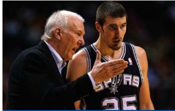
Avec Gregg Popovich, coach des Spurs, où Nando a joué entre septembre 2012 et février 2014.

joueurs plus jeunes et de tout faire pour les aider à progresser. Après, comme je viens de le dire, cela dépend du caractère de chacun. Cela doit être aussi difficile, quand on a fait autant pour l'équipe de France et que c'est votre dernière campagne, de ne pas parvenir à atteindre son but. Mais bon... je le répète, ça a été un été compliqué. Tous les joueurs ont vraiment eu du mal à trouver leur place. Même quand Rudy (Gobert) est arrivé dans l'équipe, ça n'a pas été simple. Parce que ça a redistribué pas mal de cartes dans le secteur inférieur. Voilà... Le plus important maintenant, c'est de se tourner vers le futur, parce que pour nous, l'équipe de France, ça ne se terminait pas aux J.O. de Rio. Il faut donc juste apprendre de nos erreurs et se préparer au mieux pour les compétitions à venir.