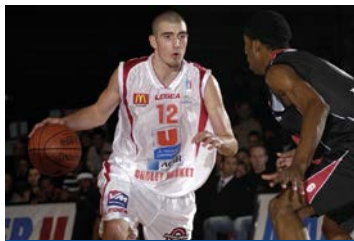
Nando, sous le maillot de Cholet Basket, avec qui il a remporté la Semaine des As (aujourd'hui devenue la Disneyland Paris Leaders Cup LNB), en 2009.

Oui, bien sûr. De toute façon, il va y avoir beaucoup de changements l'été prochain. Trois joueurs majeurs arrêtent. Il va donc falloir les remplacer. La meilleure chose à faire, c'est sans doute de rappeler tous les joueurs qui peuvent prétendre à cette équipe de France et relancer un peu une forme de concurrence pour que l'on retrouve cette agressivité, cette envie qu'on a pu avoir par le passé et qui nous a sans doute fait défaut l'été dernier. Après, évidemment, il y aura toujours ce noyau historique vers lequel on pourra se tourner. Mais il faudra du sang neuf au sein de l'effectif. Il faut remplacer Tony, remplacer Flo, remplacer Mike. Même Boris, il n'a plus ses jambes de 20 ans. Donc il va bien falloir trouver une vraie rotation à son poste. Je pense que c'est le moment pour mettre les choses à plat. Sans