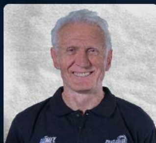
NENO ASCERIC COACH