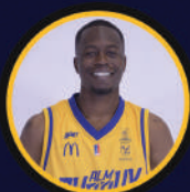
1 BUBU PALO